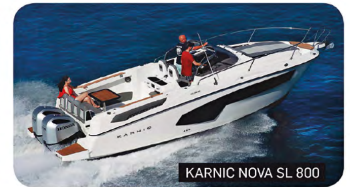
KARNIC NOVA SL 800