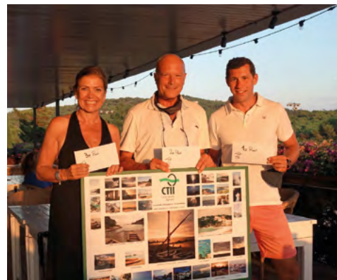
El guanyadors del concurs fotogràfic