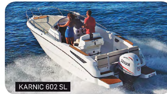
KARNIC 602 SL