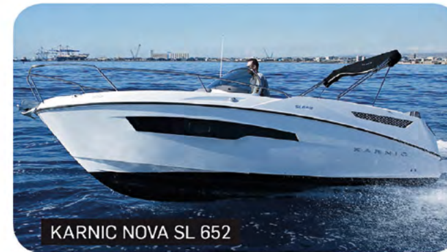
KARNIC NOVA SL 652