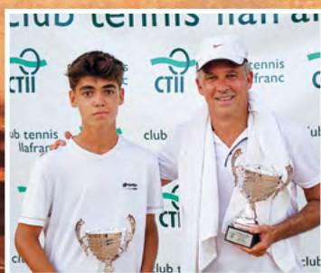
XLIII Campionats Socials