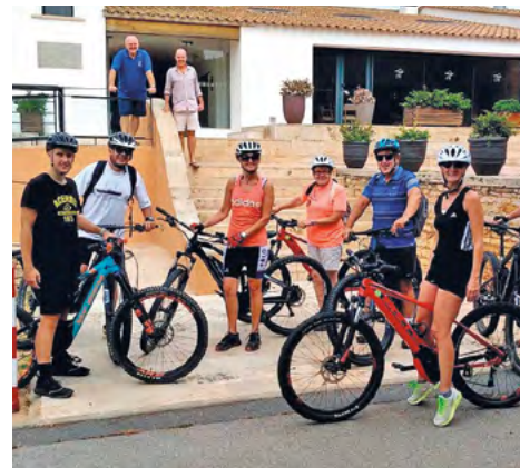
Aquest estiu vam prioritzar les activitats dirigides a l'aire lliure com l'aquagym, el ioga o les sortides amb bike