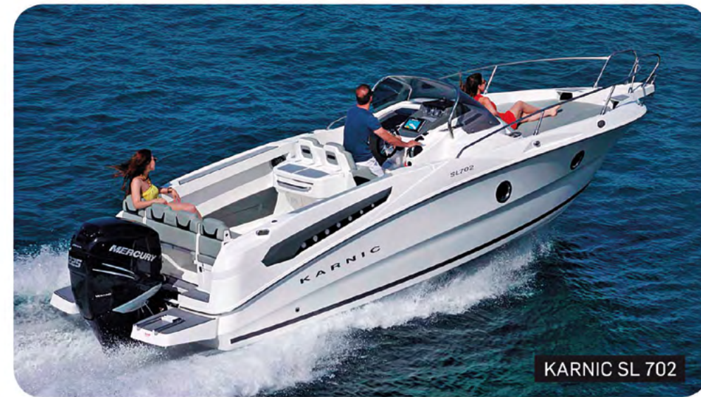
KARNIC SL 702