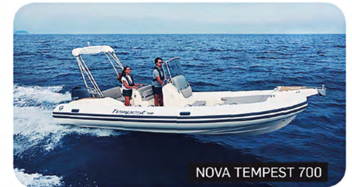
NOVA TEMPEST 700