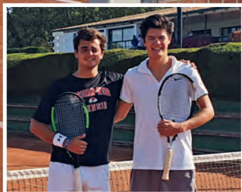
XLIIIè Campionat Social